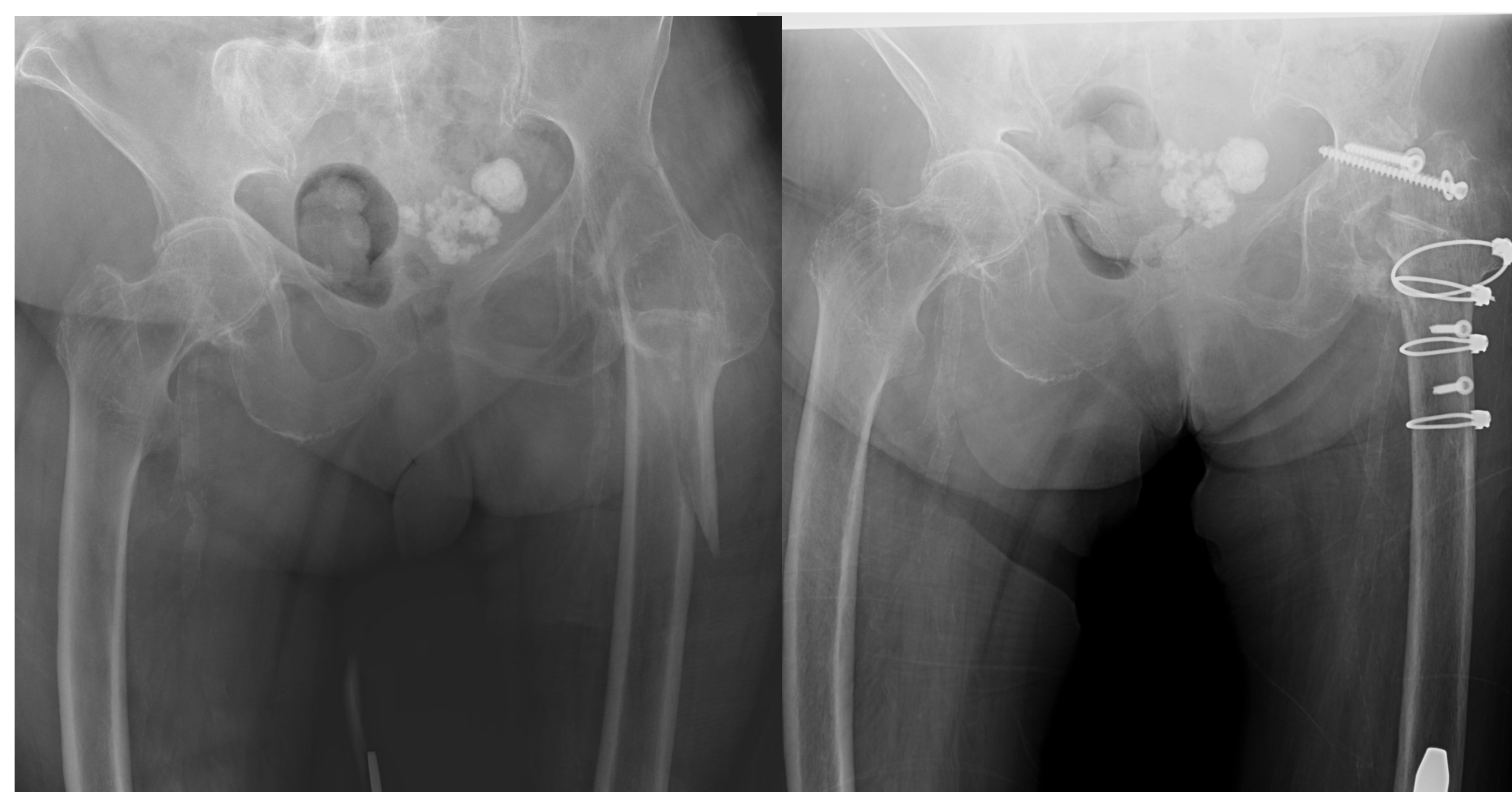
Figura 2. Radiografía Simple AP pelvis-caderas preIQ.

No se produjeron complicaciones perioperatorias y la paciente presentó buena evolución clínica, recuperando la funcionalidad que presentaba previamente.